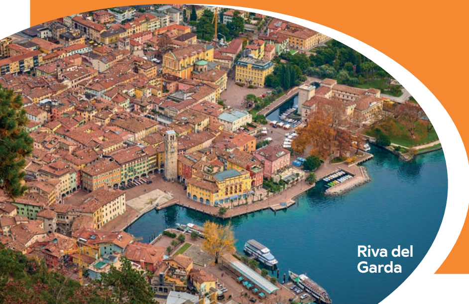
Riva del Garda

For all those who are in search of the perfect picture, get off at the Reamol stop and you'll find yourself right at the beginning of the Lake Garda cycle path, suspended along the cliff above the lake! The ride ends in Riva del Garda, in the Trentino region!